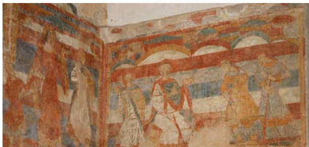
Les fresques à l'intérieurs de l'église des Salles-Lavauguyon