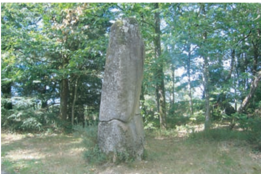
Le Menhir du Pic à Javerdat