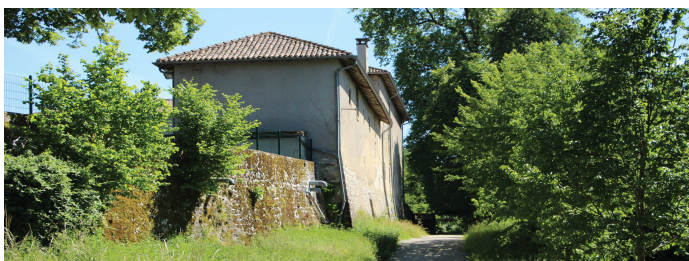
Sentier qui borde le manoir du Châtelard.