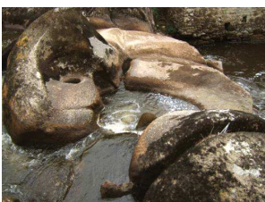
Marmites créées par la Glane.

Certaines marmites se superposent et même s'emboîtent sur deux, voire trois niveaux. Ces niveaux correspondent à autant d'étapes dans le creusement du lit, les supérieurs étant les plus anciens. Leur âge est à mesurer en dizaine de milliers d'années. Les plus belles marmites s'observent de la passerelle du gué Giraud.